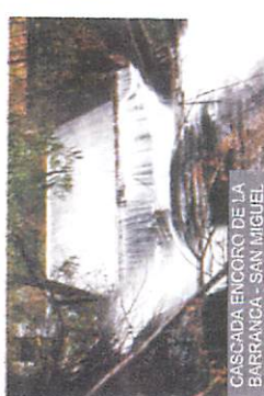
CASCADA ENCORO DE LA BARRANCA - SAN MIGUEL