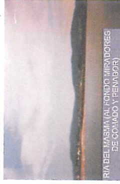
RIA DE MASMA (AL FONDO MIRADORES DE COMADO Y PEVAJOR)