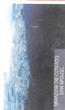
MIRADOR DE COMADO SAN MIGUEL